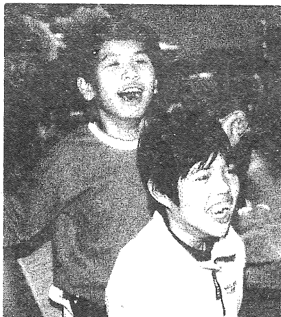
エアートランポリンでのりのり!