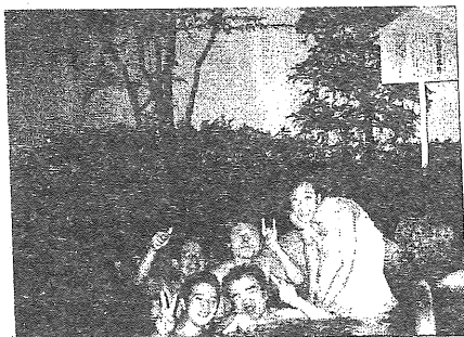
露天風呂気持ちいいー

まずは、ロングドライブの疲れをいやすべく、おきまりの温泉タイム。中途半端な季節の平日とあって、浴場はガラガラの貸し切り状態。デイサービス旅行史上初の露天風呂もあり、参加者一同、大満足。