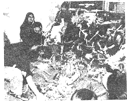
みんなで紙あそび、楽しいネ!

A: 利用者への対応はマンツーマン を基本にしています。本人の状況 に合わせて、散歩に行ったり、音 楽を聴いたり、思いっきり体を動 かしたりと様々です。時にはみん なで一緒にリクリエーションを楽し んだりします。