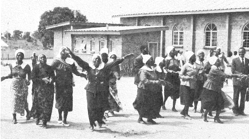
地域の教会で踊りながらむかえてくれる人たち

今回の研修のテーマは「変 革への学び」です。世界 各国のキリスト教社会施設で 働く人々が共に集い、真の意 味での「開発」のありかたを 話し合いました。その中で、 「開発援助」の問題について 私たちの姿勢が問われました。 お金の物を送るだけという 事は、その場しのぎの行為 ではないか(しかし多くの場 合は本当に必要などという 物資は供給されている)、 次の年や何年後には、また お金の物が必要になる。こ のような「援助」のあり方 は、いつまでもたっても自立 の助けにはなりません。今の 一部の力を持つ者のみが富 む(一部を助ける者のみか富 む)のまま援助を続けたとし ても、一体誰のための援助な のかが問題となってきます。 まさに、不平等な社会を変革 するための「援助」が必要 なのである。そのためには、 私たち自身が、第三世界 の人々との関係を自ら、自 変革しないといけないと痛切