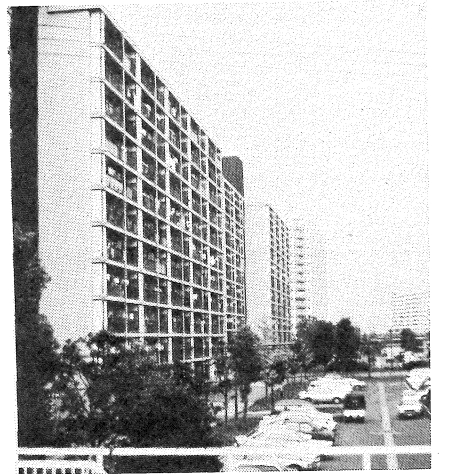
向島ニュータウン

私がこの向島と呼ばれる土地に移り住んだのは、一九八二年の三月十八日だったと記憶しています。それより一年あまり前、私も今よりは少なく、家の中の市営住宅への入居が内定して、その後、私は、機会あるごとに、この向島を訪れ、自分が入居する棟の工事の進