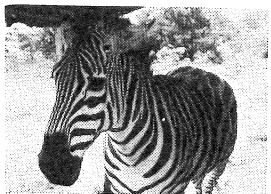
こういうイメージが困ってシマウマ

今回の研修のテーマは「変 革への学び」です。世界 各国のキリスト教社会施設で 働く人々が共に集い、真の意 味での「開発」のありかたを 話し合いました。その中で、 「開発援助」の問題について 私たちの姿勢が問われました。 お金の物を送るだけという 事は、その場しのぎの行為 ではないか(しかし多くの場 合は本当に必要などという 物資は供給されている)、 次の年や何年後には、また お金の物が必要になる。こ のような「援助」のあり方 は、いつまでもたっても自立 の助けにはなりません。今の 一部の力を持つ者のみが富 む(一部を助ける者のみか富 む)のまま援助を続けたとし ても、一体誰のための援助な のかが問題となってきます。 まさに、不平等な社会を変革 するための「援助」が必要 なのである。そのためには、 私たち自身が、第三世界 の人々との関係を自ら、自 変革しないといけないと痛切