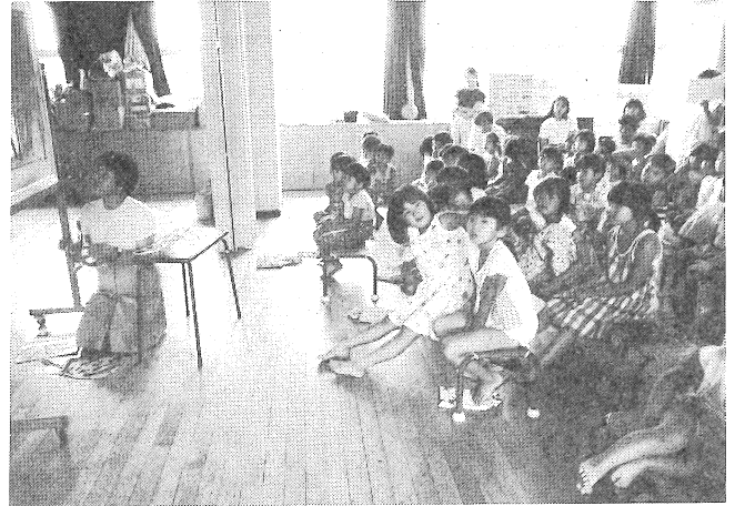
フランネルグラフ楽しいな(土曜学校デイキャンプ)