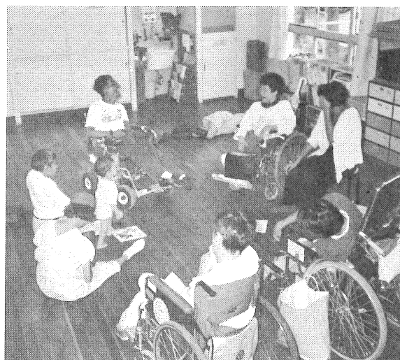
劇団「態変」の練習風景